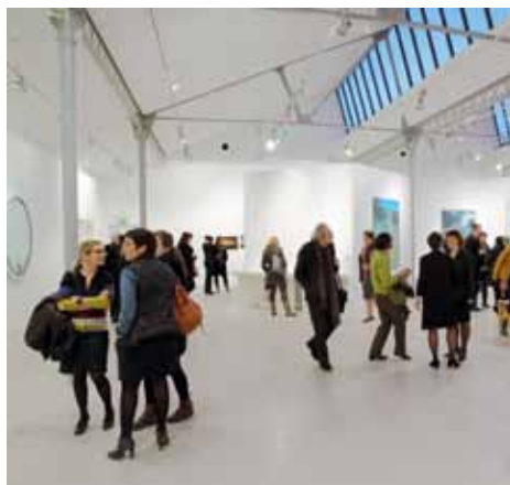
Espace Cornil

Ouvert en juin 2001, le musée Paul-Dini de Villefranche-sur-Saône présente les travaux d'artistes ayant un lien de vie ou de travail avec la région Rhône-Alpes. Le musée constitue une structure jeune dans un lieu architectural lumineux et rénové présentant l'art moderne et la création contemporaine sur deux espaces dits Grenette et Cornil.