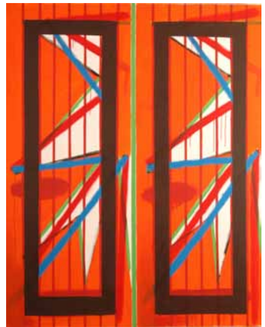
Bernard Piffaretti , Sans titre - BP 187 , 2003. Acrylique sur toile. 250 x 200. Donation Muguette et Paul Dini 6, 2009. Villefranche-sur-Saône, musée Paul-Dini, musée municipal.