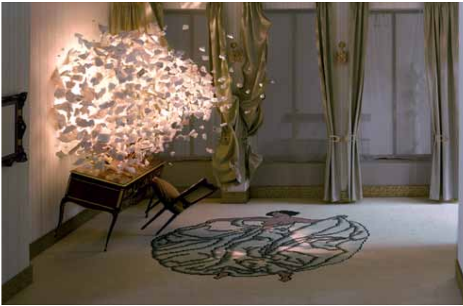
Jean-Antoine Raveyre , Bleu, blanc, or , 2012. Prise de vue argentique, tirage fine art, 3 exemplaires, 110 x 170 cm.