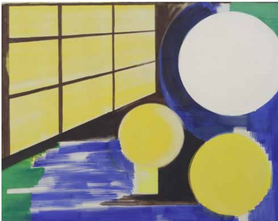
Corinne Chotycki, Nuit électrique , 2011. Tempera sur toile. 115 x 145 cm. Collection de l'artiste. © Corinne Chotycki

Les Paravents , 1986. Email à froid sous verre. 12.8 x 23 cm. Saint-Étienne métropole, musée d'Art moderne, inv. 86.11.5