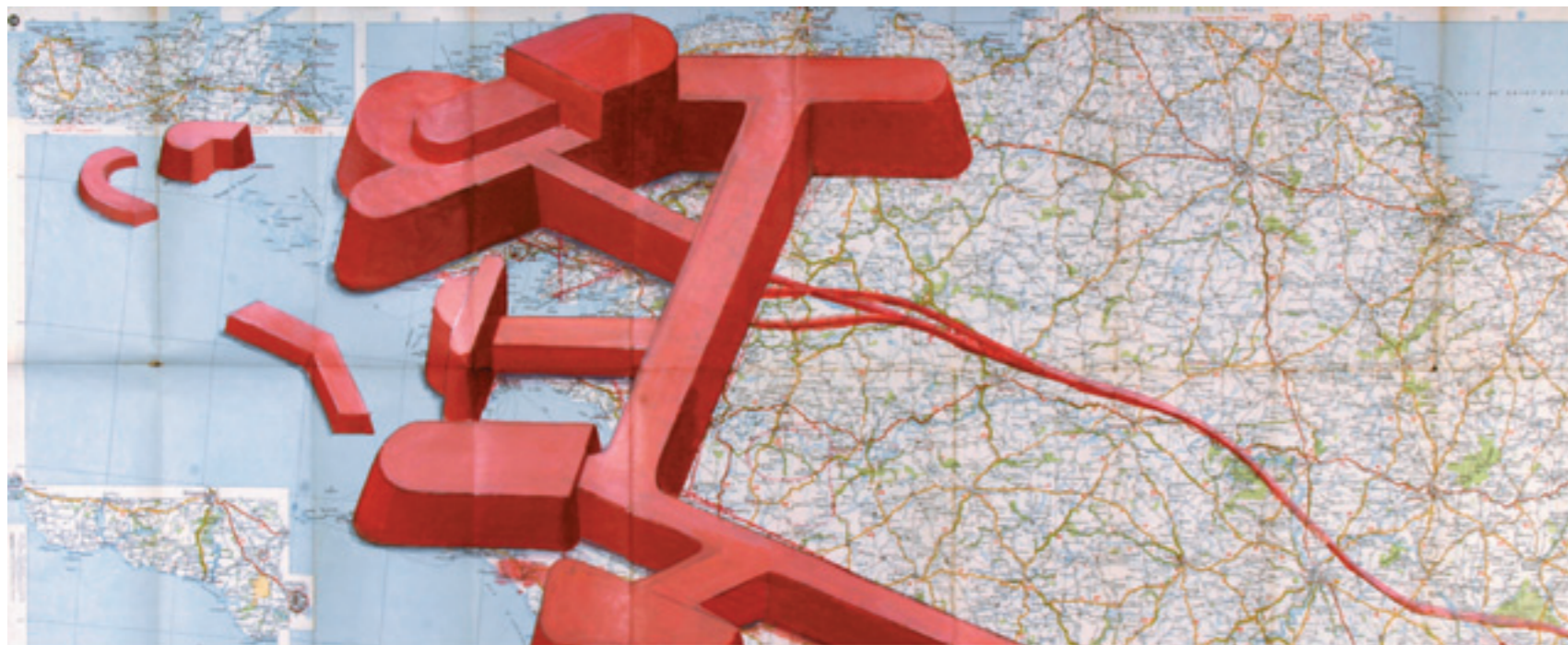
Mihael Milunović, Bunker , 2005. Une architecture défensive se déploie, en perspective, sur l'ensemble de la France. Le support est l'assemblage d'une trentaine de cartes routières des régions. Ici un détail de la Bretagne. © Mihael Milunović