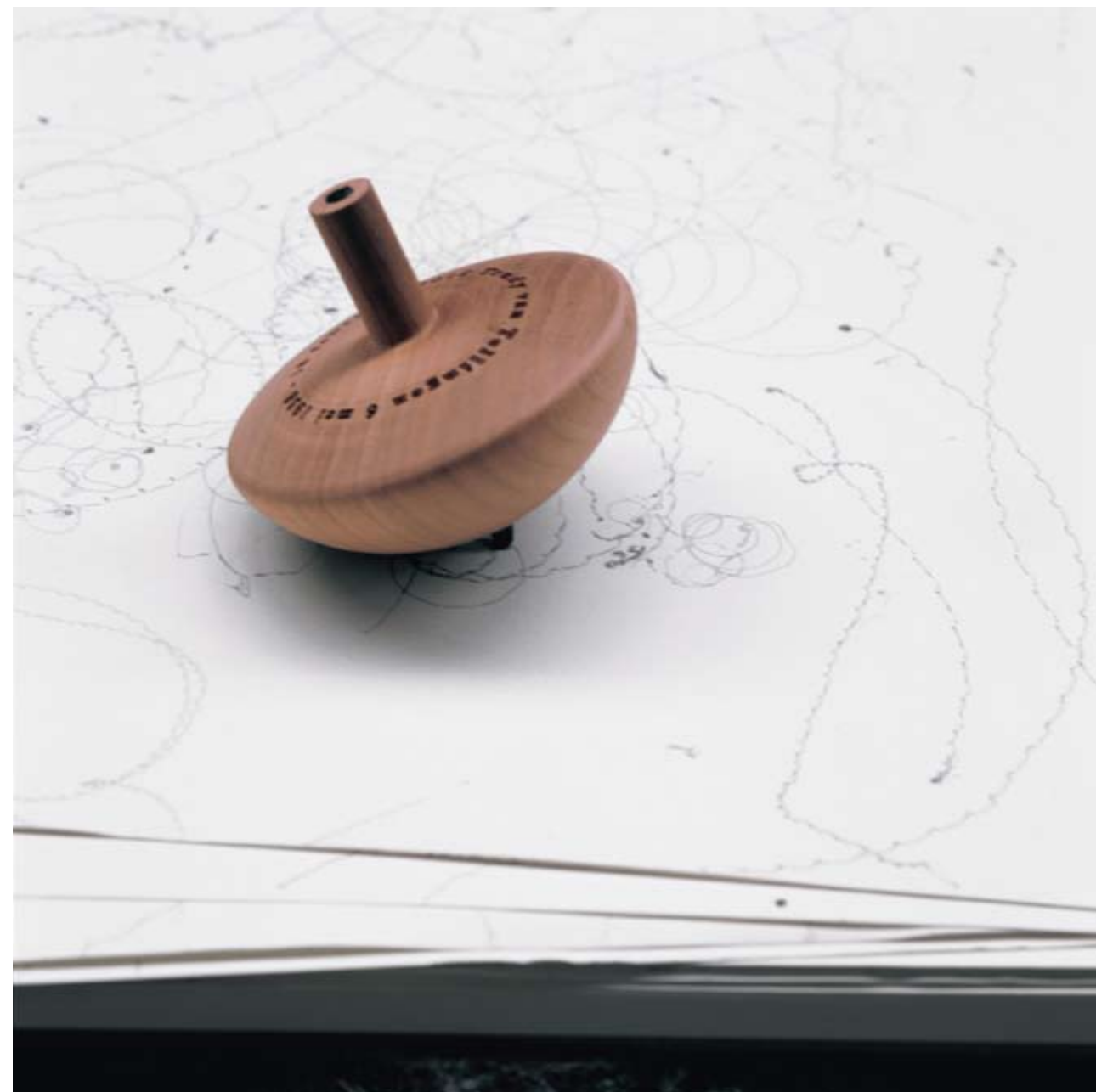
Merel van Tellinggen, carbon & calcium , 2005. After cremation, the substance is used to create functional objects. The record player book is a paper book that uses diamond as a needle to play record. Writing spinning tops uses carbon to spin. © Sabine Piggale