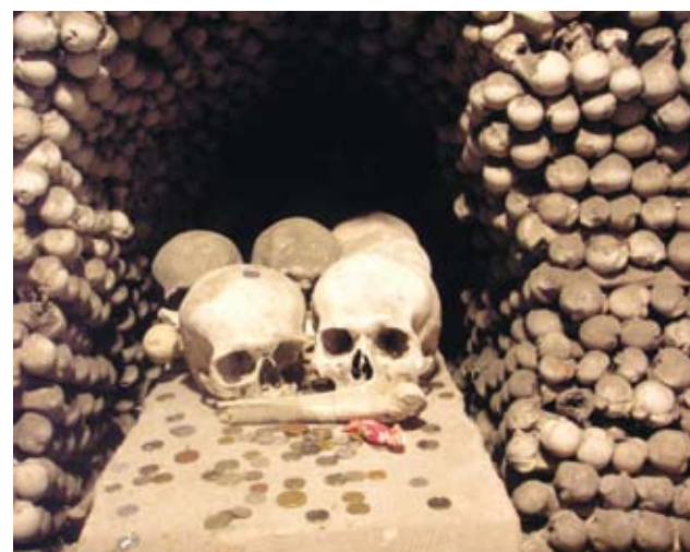
Chapelle de Sedlec, Kuntna-Hora, Janvier 2006.