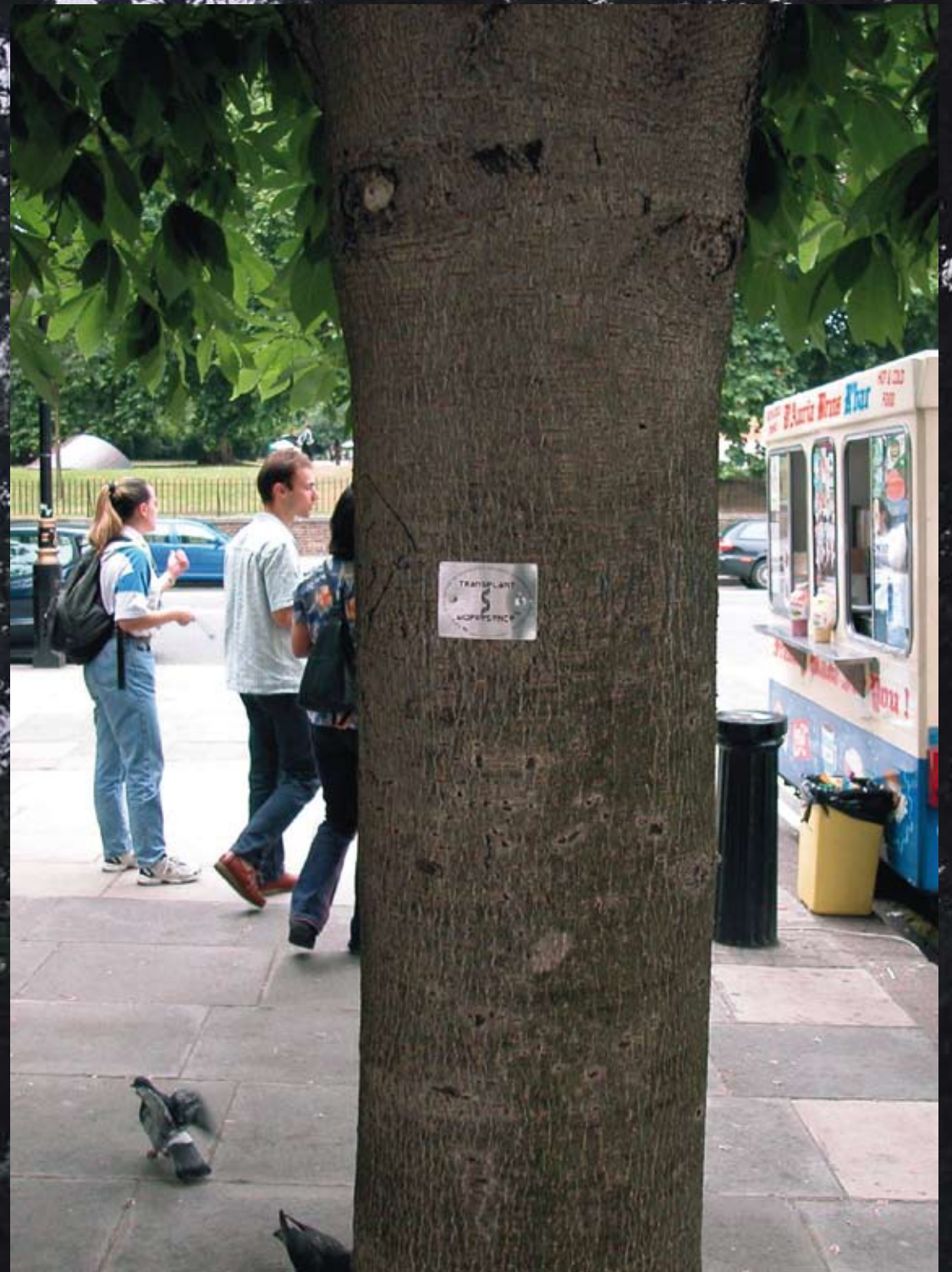
Georg Tremmel & Shiho Fukuhara Biopresence , 2003. © Biopresence