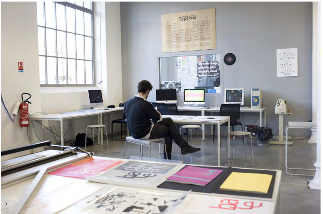
1. Projet de Jean-Baptiste Bru, DNSEP design 2012 2. ESADSE - Pôle édition © Sandrine Binoux