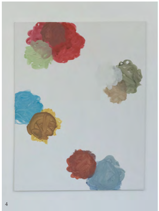
1. Workshop Compagnie Litecox 2. Projet de Marlène Huet DNSEP Design 2012 3. Projet de Pauline Vial DNSEP Art 2012 4. Projet de Romain Rivière DNSEP Art 2012