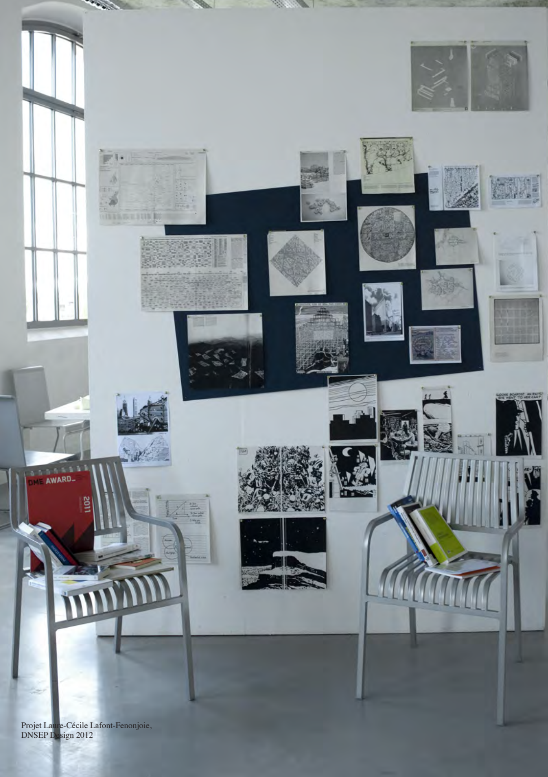
Projet Laure-Cécile Lafont-Fenonjoie, DNSEP Design 2012