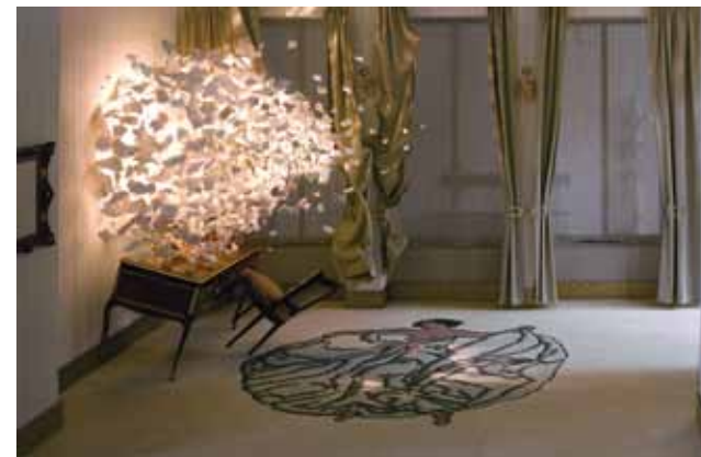
Jean-Antoine Raveyre , Bleu, blanc, or , 2012.

Prise de vue argentique, tirage fine art, 3 exemplaires, 110 x 170 cm.