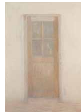
Jacques Truphémus , La porte de l'atelier , 1992. Huile sur toile. Donation Muguette et Paul Dini 1, 1999, Villefranche-sur-Saône, musée Paul-Dini, musée municipal

tarif : 4€ pour les personnes qui assistent à la visite commentée sur présentation du ticket d'entrée du musée