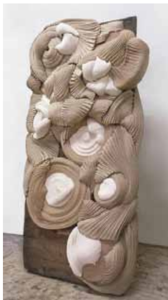
Jérémy Gobé, La Porte , 2012. Porte, sangle de tapisserie et tissu des Vosges, aiguilles et clous, 100 x 190 cm. Collection de l'artiste

Un accrochage renouvelé de la collection permanente du musée: une histoire de la peinture à Lyon et en Rhône-Alpes de 1865 à nos jours. Cherchez les fenêtres : il y en a !