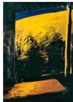
Patrice Giorda , La Pentecôte n° 3 , 1990. Acrylique sur toile. Donation Muguette et Paul Dini 1, 1999, Villefranche-sur-Saône, musée Paul-Dini, musée municipal

Entrée libre et gratuite pour tous, animations musicales et guidées