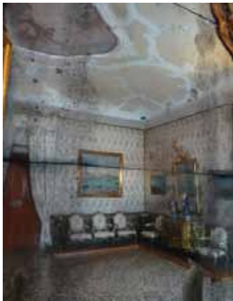
Jacqueline Salmon, Extrait de la série Miroirs de Venise , 2009. 32 x 45 cm, épreuves pigmentaires sur papier Baryté (tirage de l'artiste). Collection de l'artiste, Courtesy galerie Mathieu, Lyon