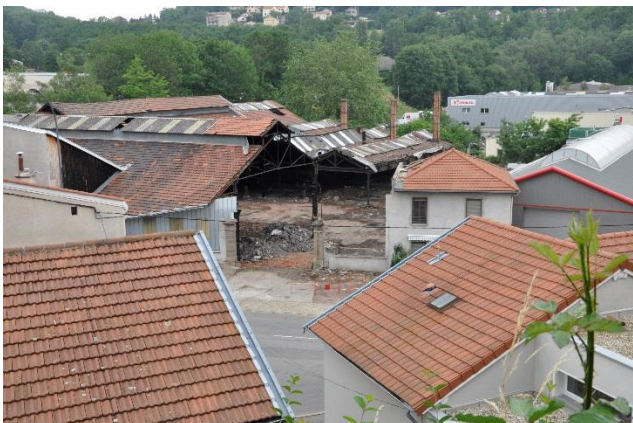
Etude Terrenoire 2013, Laboratoire IRD

Inscription préalable au service de la scolarité, ainsi qu'auprès des référents