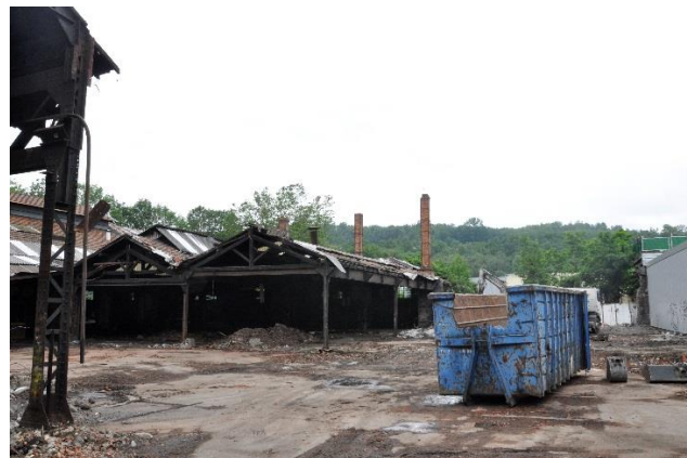
Etude Terrenoire 2013, Laboratoire IRD